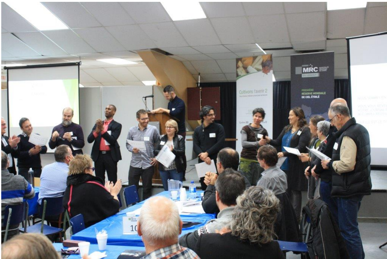
Lieu : Lambton, le 12 décembre 2017

Lac-Mégantic, le 19 décembre 2017 - Le 12 décembre 2017 avait lieu le Forum dans la cadre de l'élaboration du PDZA de la MRC du Granit. Plus de 100 personnes y ont assisté provenant de tous les secteurs. Les élus des 20 municipalités ont eu la chance d'échanger avec les différents